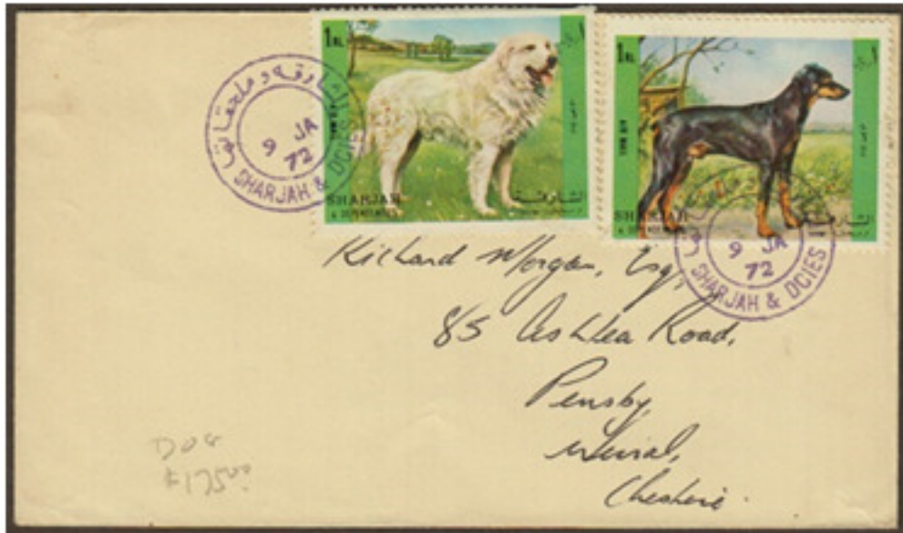
ظرف مزيف لإمارة الشارقة: طوابع حقيقية ملغاة بختم إلغاء مزيف Fabricated cover of Sharjah: Original stamps canceled with fabricated postmark