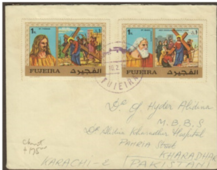
ظرف مزيف لإمارة الفجيرة: طوابع حقيقية ملغاة بختم إلغاء مزيف Fabricated cover of Fujairah: Original stamps canceled with fabricated postmark