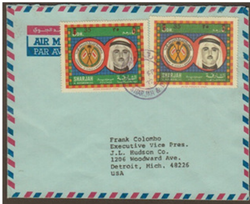
ظرف مزيف لإمارة الشارقة: هنا وضع كذلك طابع مزيف في الجهة اليمنى بالإضافة إلى آخر حقيقي جميعها ملغاة بختم إلغاء مزيف Fabricated cover of Sharjah: Forge stamp on the right side with original stamp on left both cancelled with fabricated postmark