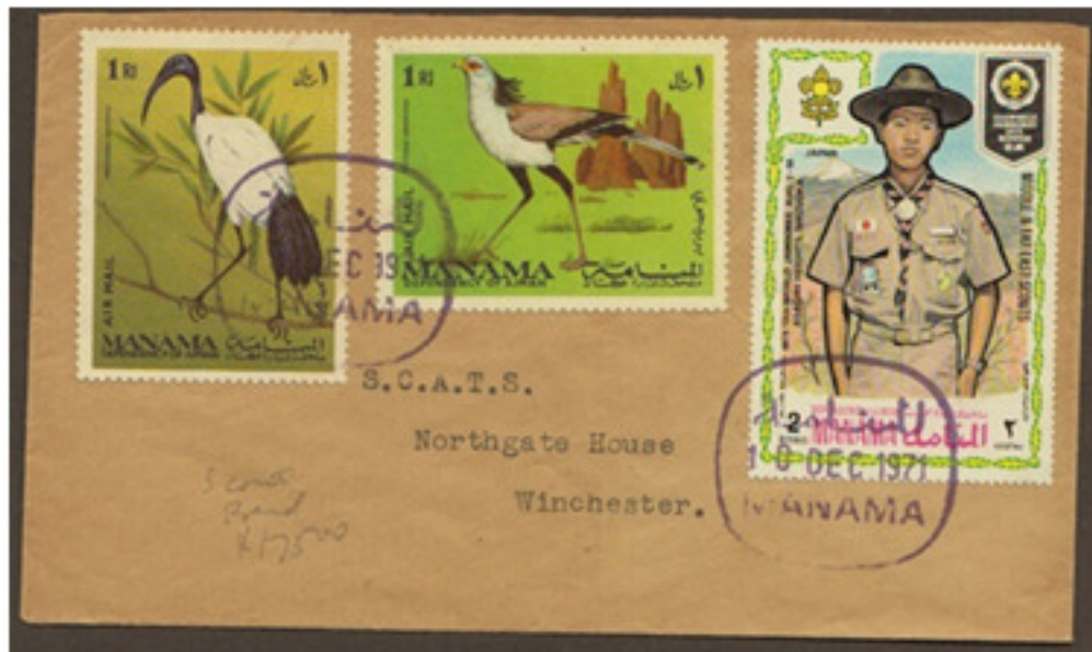
ظرف مزيف لإمارة عجمان: طوابع حقيقية ملغاة بختم إلغاء مزيف Fabricated cover of Ajman: Original stamps canceled fabricated postmark