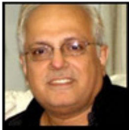
شاهد ذكي / Shahid Zaki

During the year 2012, some fabricated envelopes were seen offered through online auctions or by specialized Middle East stamp dealers. In the meantime, EPA members were received what seems to be attractive offers of Trucial States envelopes. Since the year 2012, some of these fabricated covers continued to be offered regularly via the same outlets (eBay, delcamp, and Middle East stamp dealers). As we consider our duty to warn philatelists and highlight the source behind these fabricate material, we investigated about the source and turned out with fruitful cooperation of dealers and philatelists that sole source of such material is Arif Balgamwala of Pakistan who is in collaboration with Shahid Zaki of Pakistan. Shahid is the one who is expert in such fabrication while Arif is the one who is promoting forgery in the philatelic market, when we faced him he claims that he bought such material from deceased stamp dealer (just to mislead)! Original stamp is used on original covers with fabricated postmarks. In a single case reported a forged stamp was used along with original but canceled with forged postmark (there might be more around). Target was most of the postmarks used in different Emirates before unity, we understand they had touched other areas as well.