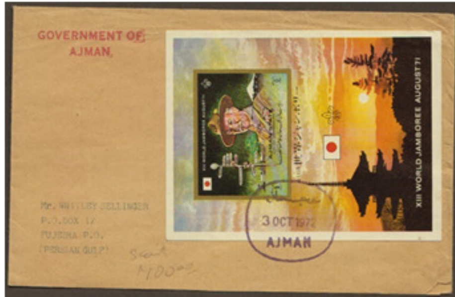
ظرف مزيف لإمارة عجمان: طوابع حقيقية ملغاة بختم إلغاء مزيف بالإضافة إلى ختم آخر مزيف باللون الأحمر لحكومة عجمان Fabricated cover of Ajman: Original stamp canceled with fabricated postmark and another fake mark of "Government of Ajman" in red