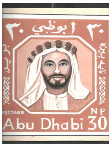
الشكل ٢ Figure 2