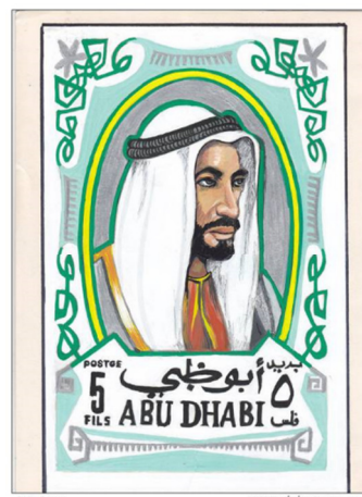
الشكل ٣ Figure 3