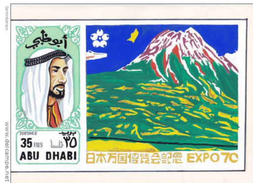
الشكل ٤ Figure 4